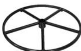
E) STER ROND E1) STER ROND ZWART