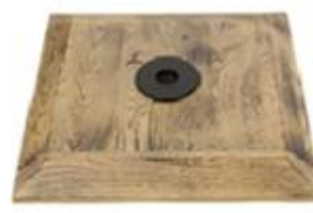
M) VOET HOUT GEBRAND