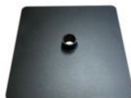
K) SCHIJF VIERKANT ZWART