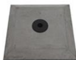
L) BETON VIERKANT