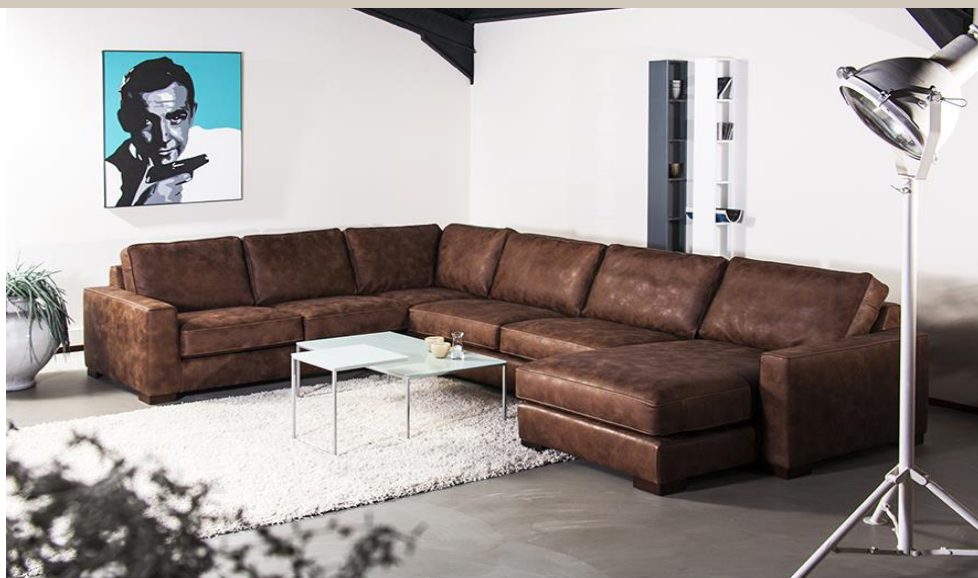
KENTUCKY HOEK IS BOVENSTAANDE AFBEELDING ECHTER MET ANDERE STIKSELS EN ZONDER BIEZEN