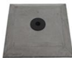
L) BETON VIERKANT