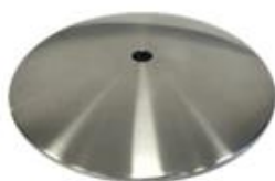
D) PLATVOET D1) PLATVOET ZWART