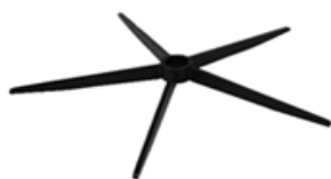
A) STERVOET ZWART