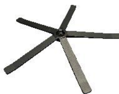
N) STER PLAT