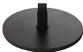
G) SCHIJF ROND ZWART