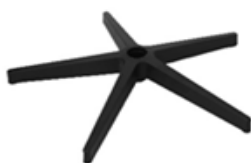
B) 5 TEENS ZWART