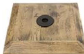
M) VOET HOUT GEBRAND