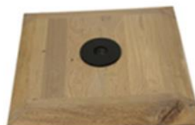
J) VOET HOUT J1) VOET HOUT ZWART