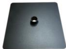
K) SCHIJF VIERKANT ZWART