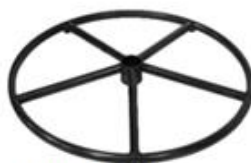
E) STER ROND E1) STER ROND ZWART